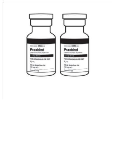
Figura 1 – Dose recomendada de PRAXBIND fornecida em dois frascos.

Não é necessária proteção contra a luz ambiente durante a infusão de PRAXBIND (vide item 5. ONDE, COMO E POR QUANTO TEMPO POSSO GUARDAR ESTE MEDICAMENTO? ).