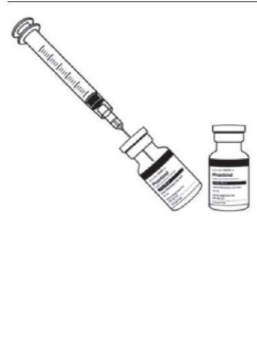
Figura 3 – Injete os dois frascos consecutivamente através da seringa.

PRAXBIND não deve ser misturado com outros medicamentos. Um acesso intravenoso preexistente pode ser utilizado para a administração de PRAXBIND. Ele deve ser lavado com solução de cloreto de sódio 0,9% antes e ao final da infusão de PRAXBIND. Não se deve utilizar o mesmo acesso intravenoso para administrar paralelamente nenhuma outra substância.