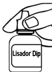
Figura 1: coloque o frasco na posição vertical com a tampa para o lado de cima, gire-o até romper o lacre.